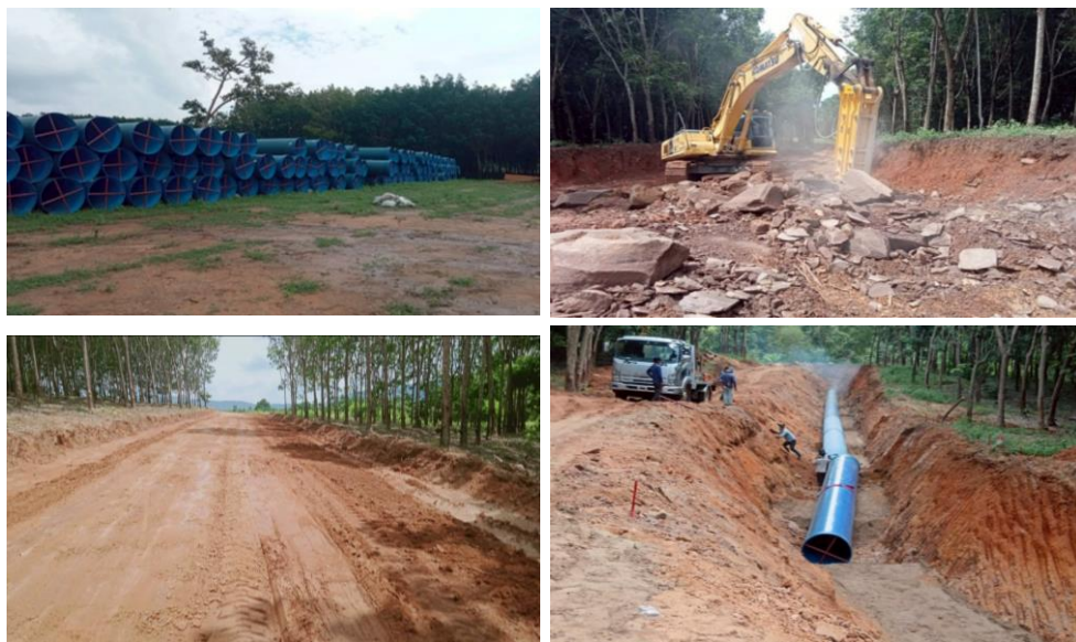
รูปที่ 1.7-1 ความก้าวหน้าการก่อสร้างระบบท่อส่งน้ำพร้อมอาคารประกอบฝั่งขวา